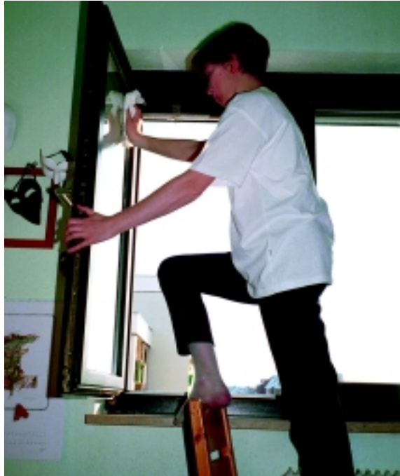
Abb. 3: Die Notwendigkeit zur Hilfeleistung ist häufiger im Haushalt als im Straßenverkehr gegeben – das gilt es zu vermitteln

Die Unterrichtsinhalte erweisen sich letztlich also oftmals als inkompatibel, weil das neue, zu erwerbende Wissen nicht mit dem vorhandenen Wissen der Teilnehmer verknüpft werden kann. Das Gelernte bleibt „nicht zuletzt auch deshalb unbeständig, instabil und (gerät) bald in Vergessenheit“ (13).