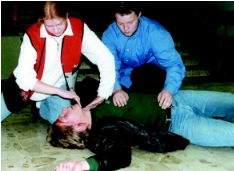
Abb. 4: Das Nicht-alleine-Lassen ist eine wertvolle und in ihrer Wirksamkeit nicht zu unterschätzende Hilfe

Sofern bislang überhaupt praktisch geübt wird, steht offenbar zu häufig die Durchführung einer einzelnen Maßnahme im Vordergrund, ohne sie in einen umfassenden Handlungsablauf zu integrieren. So wird das Anlegen eines Druckverbandes zwar mitunter kombiniert mit dem Hochhalten des verletzten Armes und dem Abdrücken der zuführenden Schlagader geübt, nicht aber gemeinsam mit der Schockbekämpfung, der Wärmeerhaltung, der psychischen Betreuung und dem Absetzen des Notrufs.