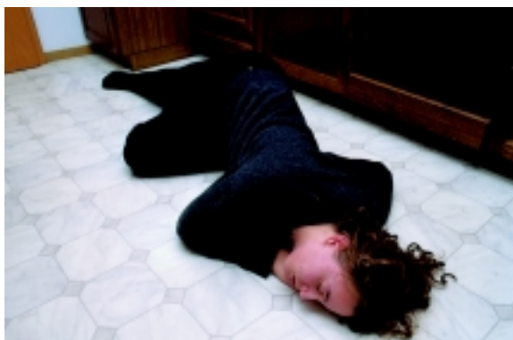
Abb. 1: Ist die leitfadengemäße Technik zur Herstellung der stabilen Seitenlage tatsächlich die einzig zulässige?

Vorteil eines somit zu fordernden didaktischen Kommentars wäre nicht nur, dass die aus wissenschaftstheoretischer